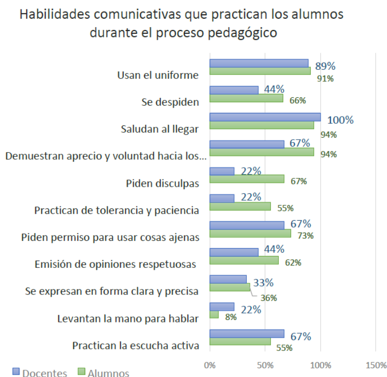
Gráfico 3. RESUMEN COMPARATIVO SOBRE HABILIDADES COMUNICATIVAS QUE PRACTICAN LOS ALUMNOS DURANTE EL PROCESO PEDAGÓGICO. Encuesta aplicada a los docentes de la Educación Media del Colegio Nacional San Francisco de la Colonia San Francisco - Repatriación año 2018.

La capacidad de poner atención cuando alguien les habla alcanzó el porcentaje más alto tanto por docentes como por alumnos. Respecto al nivel más bajo, la capacidad de evitar distraer o distraerse cuando alguien les habla muestra una tendencia casi coincidente por ambos grupos encuestados (33% alumnos, 66% docentes), aunque los alumnos han encontrado como nivel más bajo la capacidad de no emitir opiniones antes de escuchar todo al otro (59%). Esto sugiere una necesidad de reforzar la escucha activa y la paciencia en la interacción, habilidades esenciales para una comunicación efectiva (FAPap, s.f.). La distinción entre "oír" y "escuchar activamente" es fundamental; mientras que oír es un proceso pasivo, la escucha activa implica un esfuerzo consciente por comprender el mensaje completo, incluyendo el lenguaje no verbal y las emociones subyacentes (FAPap, s.f.; Euroinnova, s.f.). La interrupción prematura o la distracción pueden generar malentendidos y afectar la calidad de la interacción interpersonal en el aula (SciELO Cuba, 2019b; Euroinnova, s.f.).